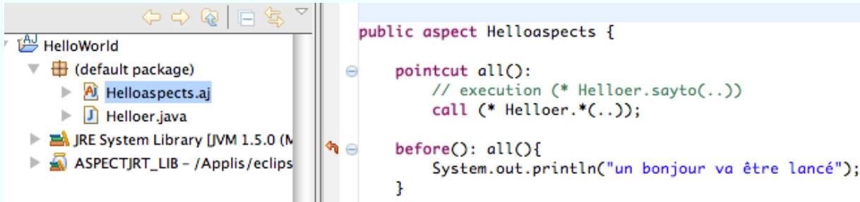
FIG. 1 – advice “before”

un bonjour va être lancé ... Hello to: pierre un bonjour va être lancé ... Hello to theatre: paul, jean,