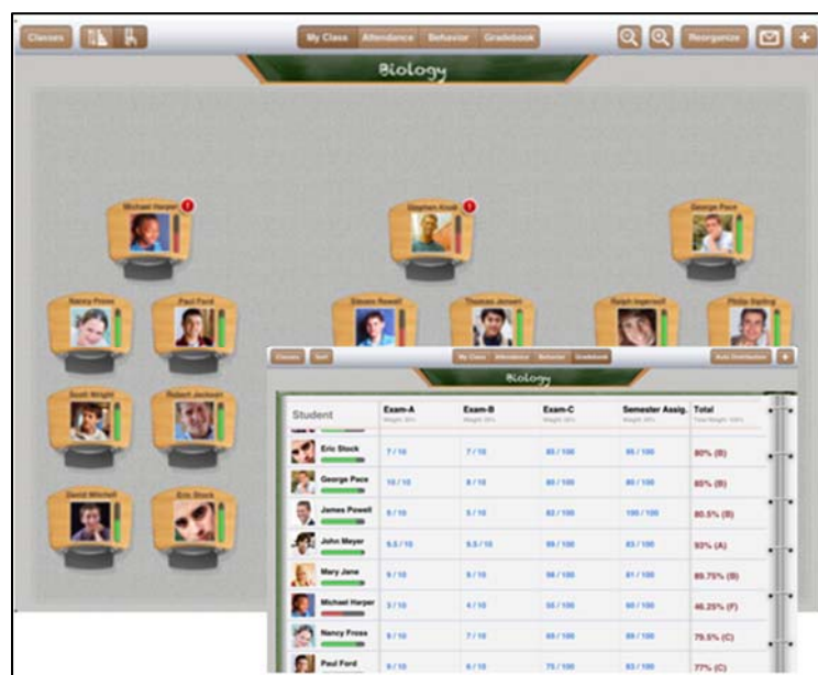
Figure 3 : TeacherKit utilisée dans le scénario 5 « Suivi de présence »

Scénario 6 : « Programmation. » Dans ce cas d'utilisation les étudiants sont amenés à mixer TP informatique et cours en utilisant un interpréteur pour coder/tester/debugger des petits programmes. Ce scénario est en cours de formalisation ; il utilisera plusieurs applications telles que MathLab, iSQL, Python3, en relation avec les langages de programmation utilisés.