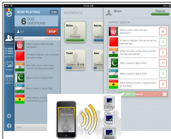
Figure 2. ECliker Presenter utilisée dans le scénario « Evaluation à partir de QCM »