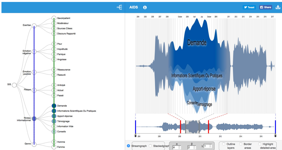
FIGURE 3 – Visualisation de la dimension "Niveau informationnel" dans laquelle les messages relatifs à la classe "Information vide" ont été filtrés grâce à l'arbre d'agrégation.