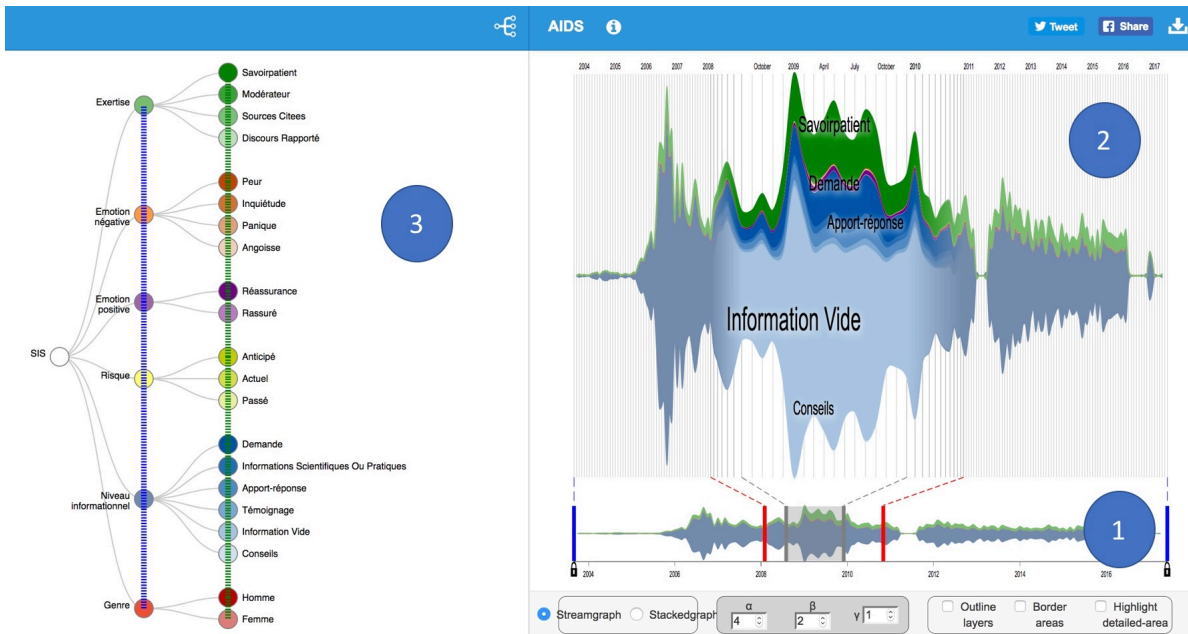
FIGURE 2 – Visualisation des séries temporelles avec un focus sur la période 2008-2011.