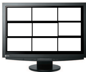
FIGURE 1 – Division de votre écran.

Question 1. Affichez trois figures de même taille occupant \frac{1}{3} de l'écran en hauteur (attention cela doit fonctionner quelque soit l'écran et pas seulement sur le vôtre). Les trois figures doivent être disposées les unes sous les autres et occuper toute la largeur de l'écran. Divisez chaque figure en 3 sous figures comme illustré sur la Figure 1.