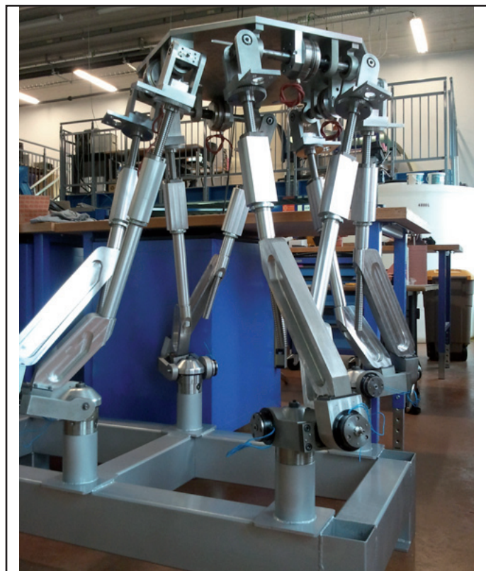
Figure 3 - Robot octopode REMORA