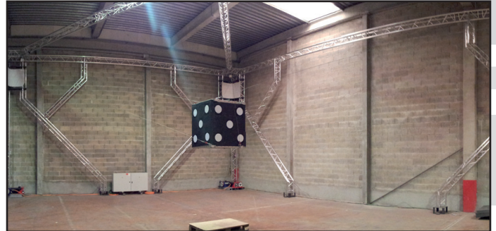
Figure 4 - Manipulateur à câbles du projet ANR CoGiRo

d'analyse statique des robots parallèles à câbles [GCicra12] et par une démarche systématique et originale du choix de la disposition des câbles autour de l'organe terminal [ANR COGIRO, FP7 CABLEBOT]. Ce robot est capable de déplacer des charges de plusieurs centaines de kilogrammes dans un espace de travail couvrant plus de 75% de la surface au sol occupée par le robot.